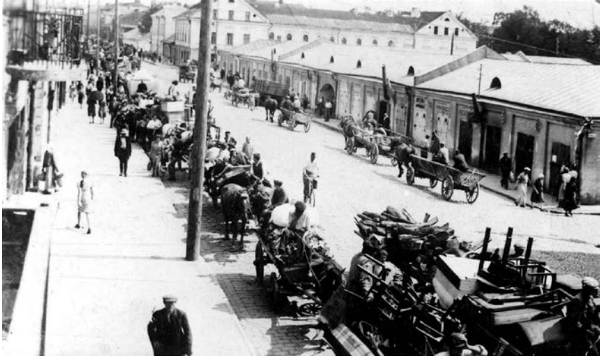
5. Nežinomas fotografas, Vežimai su žydų, besikraustančių į Viliampolėje įkurtą Kauno getą, daiktais. Dešinėje – tūščių vežimų kolona grįžta į miesto centrą, 1941 m. rugpjūtis, nuotrauka, Yad Vashem archyvas.

Unknown photographer, Carts with the belongings of the Jews being moved to the Kaunas ghetto in Viliampolė, August 1941