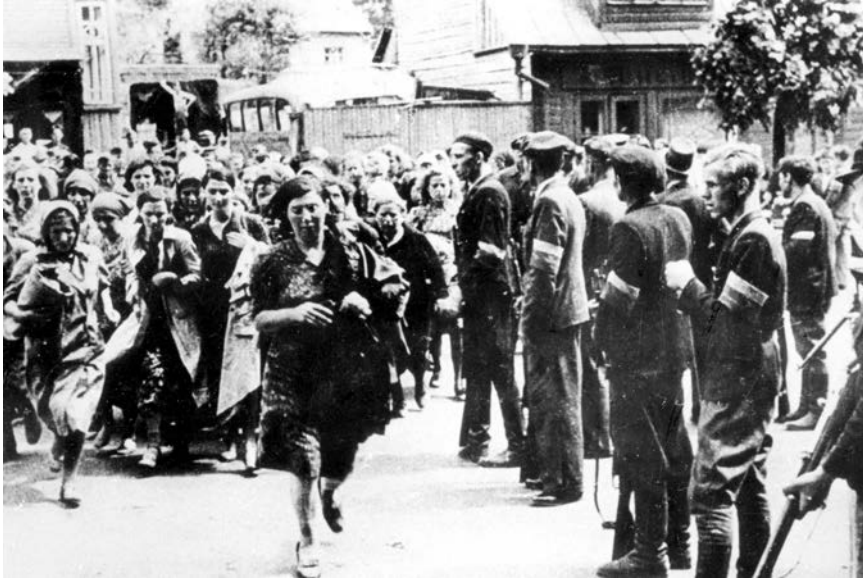
2. Nežinomas fotografas, Suimtos ir lietuvių savisaugos dalinių narių vedamos žydų moterys Kaune, 1941, fotografija, Yad Vashem archyvas

Unknown photographer, Arrested Jewish women led by members of the Lithuanian self-defence units in Kaunas, 1941