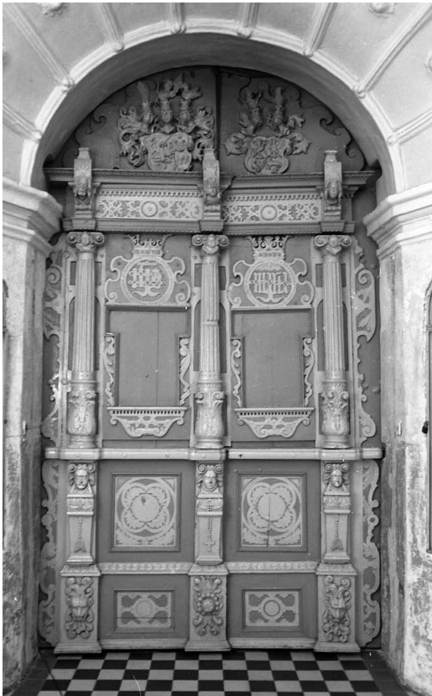
1. Kretingos bažnyčios pagrindinio įėjimo durys, Jolantos Klietkutės nuotrauka, 2007

The main entrance door of Kretinga church