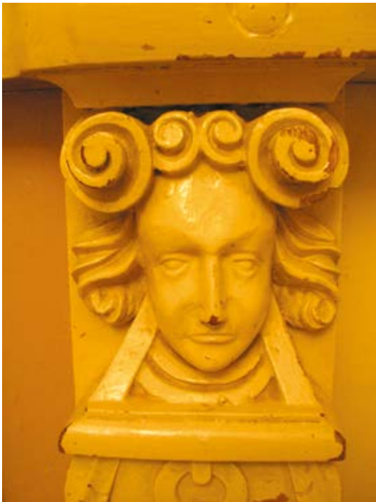
3. Kretingos bažnyčios pagrindinių durų fragmentas, Jolantos Klietkutės nuotrauka, 2007

The fragment of the main entrance door of the Kretinga church