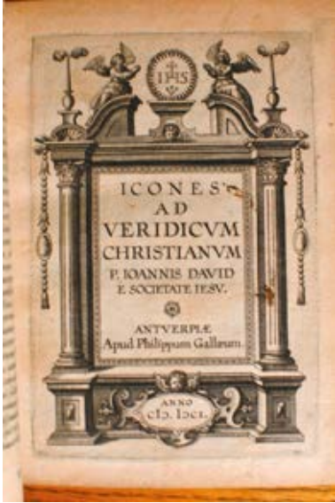
12. Joannis David, Veredicus Christianus , 1601, titulinis puslapis

Joannis David, Veredicus Christianus , 1601, title page