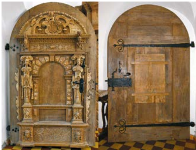
5. Kretingos bažnyčios zakristijos durys po restauravimo, Jolantos Klietkutės nuotrauka, 2008