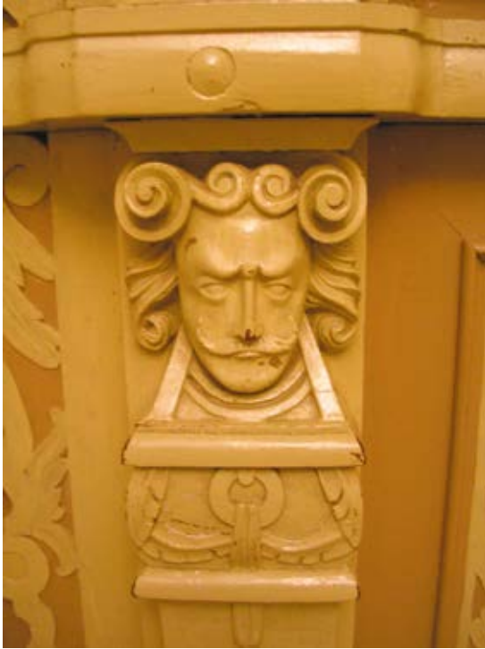
2. Kretingos bažnyčios pagrindinio įėjimo durų fragmentas, 2007

The fragment of the main entrance door of the Kretinga church