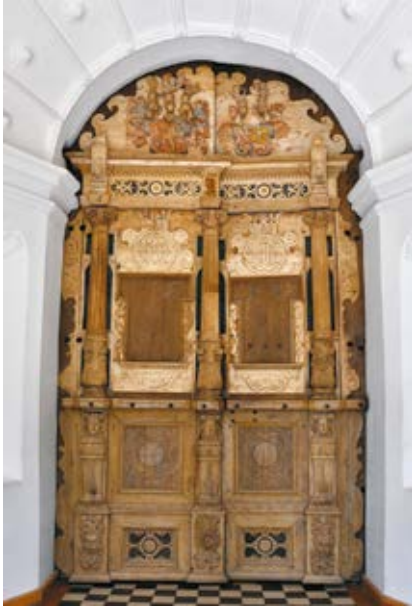
4. Kretingos bažnyčios pagrindinio įėjimo durys po restauravimo, Jolantos Klietkutės nuotrauka, 2008 The main entrance door after the restoration

taip pat kūrinio vaizdinę struktūrą siesime su bendraisiais XVI a. pabai- gos – XVII a. pradžios asmens reprezentavimo principais.