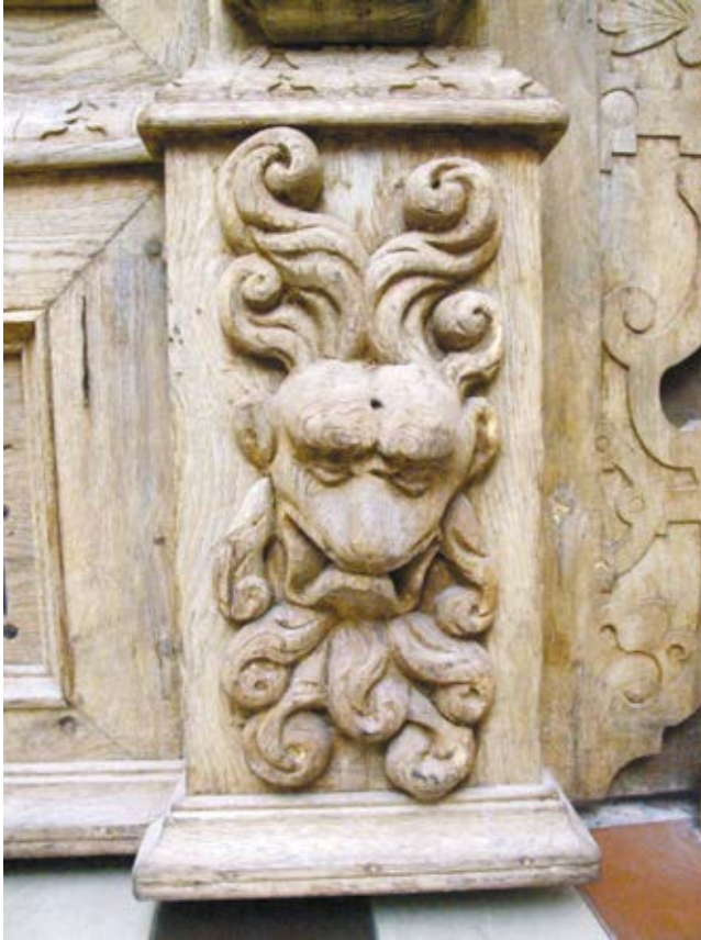
10. Liepsnojanti liūto galva, dekoruojanti šoninius cokolius, Kretingos bažnyčios pagrindinio įėjimo durų fragmentas, Jolantos Klietkutės nuotrauka, 2019

Lion's head in flames, part of a decor on the side plinths, Kretinga church, main entrance door fragment