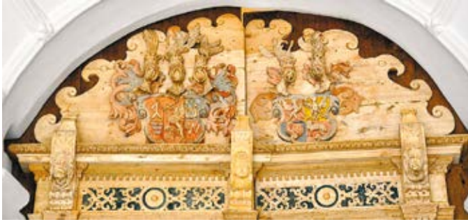
6. Herbinės kompozicijos, Kretingos bažnyčios pagrindinio įėjimo durų fragmentas, Jolantos Klietkutės nuotrauka, 2008